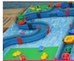
Jouons à l'eau