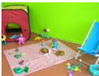
A la campagne