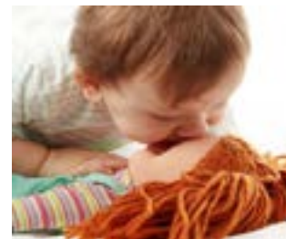
La journée des poupons