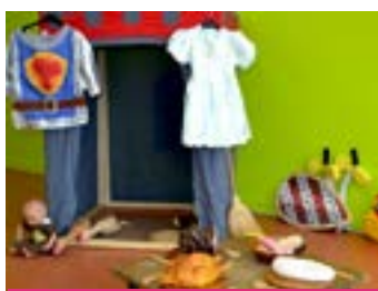
Au Moyen Âge