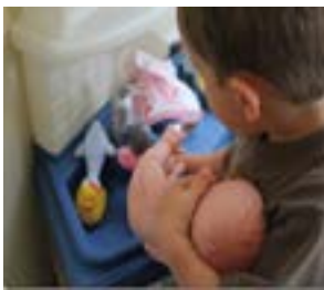
Chez le docteur